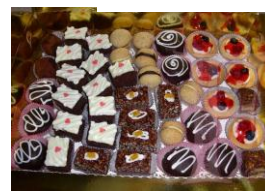
Pasticceria La Terrazza