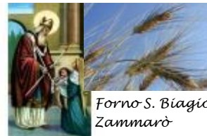
Forno S. Biagio Zammarò