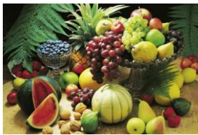
Ortofrutta Procopio Rosario